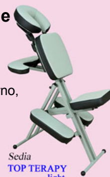
Sedia TOP THERAPY light